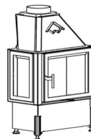
CHOPOK R90 /330 L